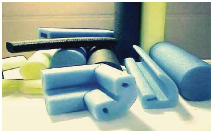
Amortiguación de baja densidad (blanda) para productos ligeros .