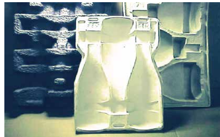
Amortiguación de alta densidad para productos pesados .